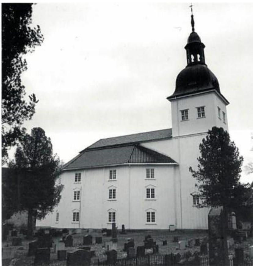
Jevnaker kirke. Se artikkel side 133

Nr. 2 2000 Årgang 18 Pris kr. 40,- ISSN: 0802-860